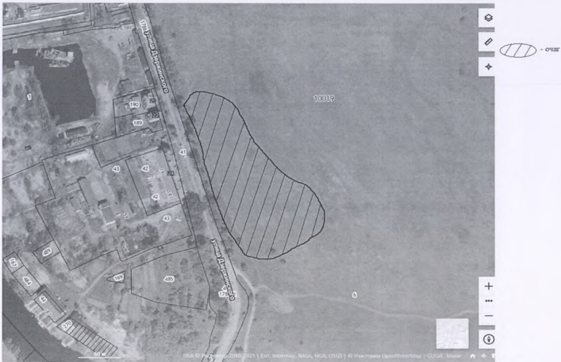
Схема границ карантинной фитосанитарной зоны по повилке ( Cuscuta spp. ) в границах земельного участка с кадастровым номером 39:02:010019:6, адрес (местоположение): Калининградская обл., Гвардейский р-н, г. Гвардейск, ул. Поселковая.